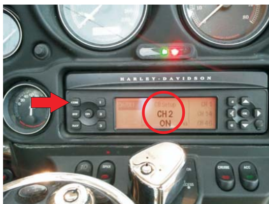
Switch on the CB