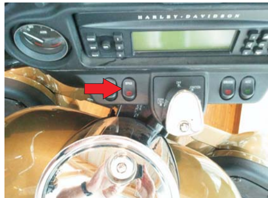
Switch off the loudspeaker to hear the sound in the helmet