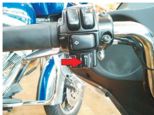
Push to talk for CB

Speech intelligibility in driver helmet with optimum setting: More then 100 miles/h - good. Especially in pillion helmet a lower intelligibility is possible when using a loud helmet type and at high speeds. With the delay from the Bluetooth transmission the voice sound reverberates a little bit but this has no influence on the speech intelligibility.