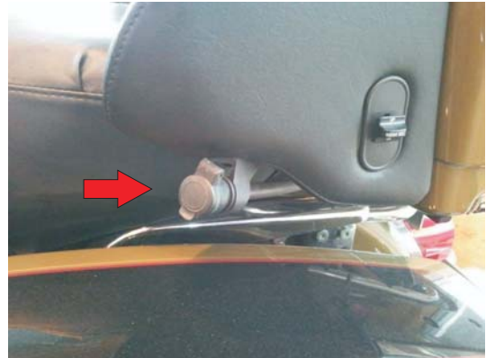
Bei Solobetrieb, können Sie auch den hinteren Stecker für den Fahrer benutzen