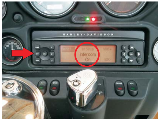
Switch on the Intercom